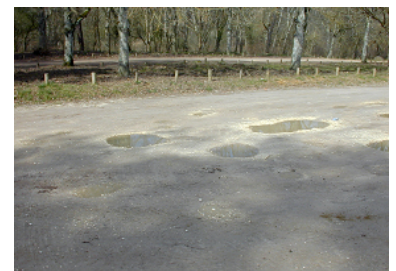
Etat de dégradation du revêtement des parkings