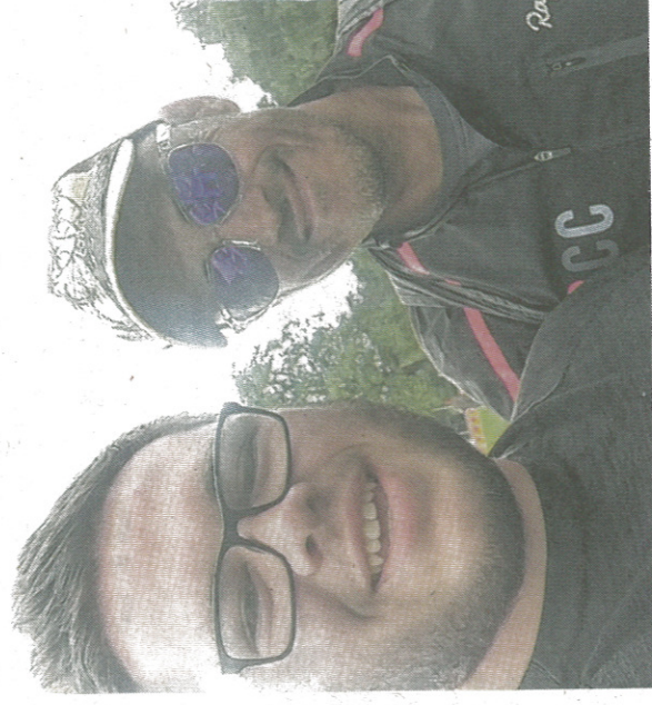
Luis Enrique a également été pris en selfie à Fontainebleau par un autre fan de foot seine-et-marnais.